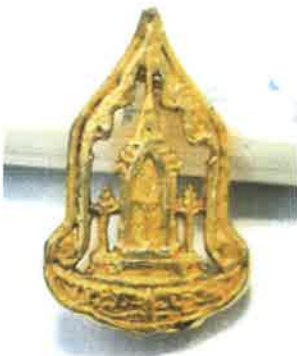
เครื่องหมายตราสัญลักษณ์กระทรวงวัฒนธรรม