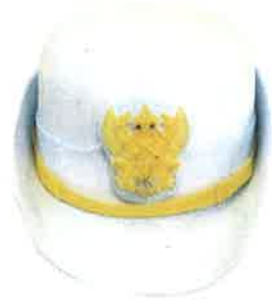
แบบหมวกผู้ปฏิบัติงานหญิง