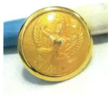
แบบดุมสัญลักษณ์ (โลหะสีทอง) ครุฑพ่าห์