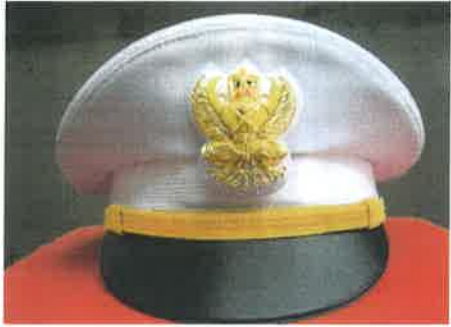
แบบหมวกผู้ปฏิบัติงานชาย