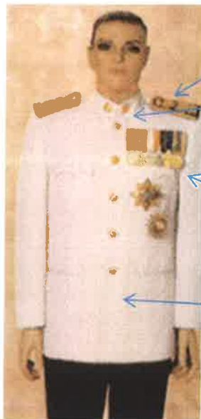
๑. เครื่องแบบปกติปกติขาว (หญิง)