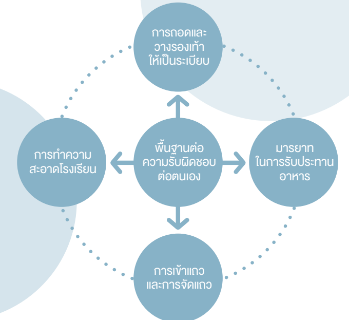
รูปภาพแสดงการเสริมสร้างคุณธรรมพื้นฐาน “จังหวัดก้าวแรกสร้างความรับผิดชอบต่อตนเองและผู้อื่น”

กิจกรรมที่เสริมสร้างวินัยให้เกิดขึ้นอื่นๆ อาทิ วินัยในการเรียน ความรับผิดชอบในหน้าที่ วินัยในการให้ดูแลรักษาสิ่งที่เป็นสาธารณะหรือส่วนรวม การเสริมสร้างการมีวินัยในครอบครัว (พ่อแม่เป็นผู้ขับเคลื่อนดูแลวินัยในบ้าน) สร้างเสริมวินัยในบ้าน (วินัยของตนเองและสมาชิกในครอบครัว) และเมื่อมีการสร้างเสริมวินัยด้านต่างๆ แล้ว ก็มีการเยี่ยมเยือนครอบครัวเสริมสร้างเด็กดีมีวินัย เพื่อค้นหาต้นแบบครอบครัวเสริมสร้างเด็กดีมีวินัย ส่งเสริมให้เด็กรู้จักการแก้ปัญหาหาตัววินัยในโรงเรียน โดยการทำโครงการ เสริมสร้างวินัยการออมและส่งเสริมเรื่องจิตอาสา ที่ดูแลน้อง