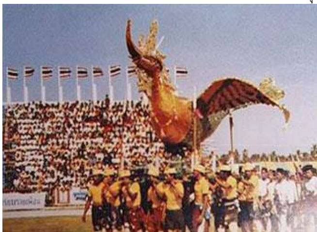
ภาพที่ 4 ประเพณีแห่กวางาย

รอบๆ ลานพระที่นั่ง เป็นที่พื่อพระทัยของพระธิดาเป็นอย่างยิ่ง จึงโปรดฯ ให้มีการจัดแห่กวางายทุก 7 วัน อีกตำนานหนึ่งว่า ชาวประมงได้นำเหตุมหัศจรรย์ที่ได้พบเห็นมาจากท้องทะเลขณะที่ตระเวนจับปลามา เล่าว่า พวกเขาได้เห็นพญานกตัวหนึ่งสวยงามอย่างมหัศจรรย์ ผุดขึ้นมาจากท้องทะเลแล้วบินทะยานขึ้นสู่อากาศแล้วหายลับไปสู่ท้องฟ้า พระยาเมืองจิงซึกถามถึงรูปร่างลักษณะของนกประหลาดตัวนั้น ต่างคนต่างก็รายงานแตกต่างกันตามสายตาของแต่ละคน พระยาเมืองต้นเต็นและยินตีมาก ลูกชายคนสุดท้ายก็รับเรื่องใคร่ได้ชม พระยาเมืองจิงป่าวประกาศรับสมัครช่างผู้มีฝีมือหลายคนให้ประดิษฐ์รูปนกตามคำบอกเล่าของชาวประมงซึ่งได้เห็นรูปที่แตกต่างกันนั้น ช่างทั้งหลายประดิษฐ์รูปนกขึ้นรวม 4 ลักษณะ คือ 1. นกกาเขาะซุรือ 2. นกกรุตาหรือนกครุท 3. นกปือเขาะมาศหรือนกยูงทอง 4. นกบุหรงซิงอหรือนกสิงห์ ในการประดิษฐ์นกนิยมใช้ไม้เนื้อเหนียว เช่น ไม้ตะเคียน ไม้ก้ายูร นำมาแกะเป็นหัวนก เนื้อไม้เหล่านี้ไม่แข็งไม่เปราะจนเกินไป สะดวกในการแกะของช่าง ทั้งยังทนทานใช้การได้นานปี สำหรับตัวนกจะใช้ไม้ไผ่ผูกเป็นโครง ติดคานหาม แล้วนำกระดาษมาติดรองพื้น ต่อจากนั้นก็ตัดกระดาษสีเป็นขน ประดับส่วนต่างๆ สีที่นิยมได้แก่ สีเขียว สีทอง (เกรียบ) สีนอกนั้นจะนำมาใช้ประดับตกแต่งเพื่อให้สีตัดกันแลดูเด่นขึ้น ปัจจุบันประเพณีการแห่กวางายจะจัดขึ้นเมื่อมีแขกผู้ใหญ่มาเยี่ยมเยียน หรือทางภาครัฐฯ จัดให้มีขึ้นมีการประกวด เพื่อเป็นการส่งเสริมศิลปวัฒนธรรมในชุมชน