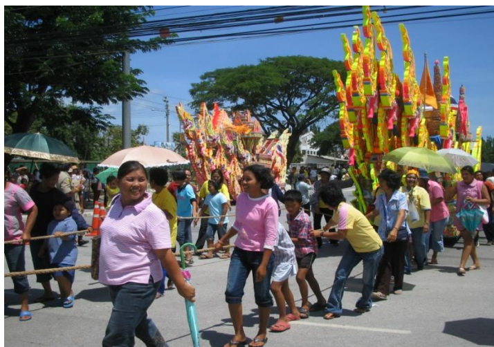
ภาพที่ 3 ประเพณีชักพระที่ จ.ปัตตานี

ประเพณีวันชิงเปรต หรืองานเดือนสิบ หรืองานสารทไทย