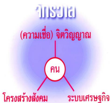
ภาพที่ 1 ระบบสังคม

ปัตตานีในอดีตเป็นดินแดนที่เคยเป็นเมืองท่าที่มีความรุ่งเรือง เป็นดินแดนที่มีการผสมผสานและความต่อเนื่องทางวัฒนธรรมโดยมีพื้นฐานมาจากศาสนาพราหมณ์ พุทธ และอิสลามตามลำดับ มนุษย์เกิดขึ้นในสิ่งแวดล้อมที่แตกต่างกัน ในที่แต่ละแห่งมนุษย์ก็ย่อมเรียนรู้ที่จะอยู่ร่วมกัน และอยู่ร่วมอย่างสอดคล้องกับธรรมชาติจึงมีวิถีชีวิตที่แตกต่างกัน เรียกว่าเป็นความหลากหลายทางชีวภาพ กับความหลากหลายทางวัฒนธรรมเป็นเรื่องที่เชื่อมโยงกัน เพราะว่าชีวิตต้องเกิดขึ้นในที่ต่างๆ ศาสนาก็เป็นอีกฐานะหนึ่ง เป็นสิ่งยึดเหนี่ยวจิตใจ เกิดขึ้นมาเมื่อมนุษย์เกิดความกลัวธรรมชาติจากเดิมเชื่อในภูตผีปีศาจ กลายมาเป็นความกลัวในศาสนา กลัวและละอายต่อการกระทำบาป ดังนั้น ศาสนาจึงเป็นวัฒนธรรมร่วมของมนุษย์เช่นกัน ศาสนาพุทธเป็นวัฒนธรรมของคนไทยส่วนหนึ่ง ศาสนาอิสลามก็เป็นวัฒนธรรมของคนไทยอีกส่วนหนึ่ง ประเทศไทยเป็นที่อยู่ของคนที่มีความหลากหลาย ทางเชื้อชาติ หลากหลายศาสนา มีทั้งไทย จีน ญวน ลาว เขมร มอญ มาลายู ศาสนาก็มีทั้ง พุทธ คริสต์ อิสลาม ฮินดู ซิกข์ ศาสนาจำเป็นต้องมีหลายศาสนา จะมีศาสนาเดียวไม่ได้ เพราะว่าศาสนาเกิดขึ้นในวัฒนธรรมต่างๆกัน ที่ใดที่มีการเข้าถึงความหลากหลายทางธรรมชาติ เข้าใจความหลากหลายทางวัฒนธรรมย่อมจะมีสันติสุข